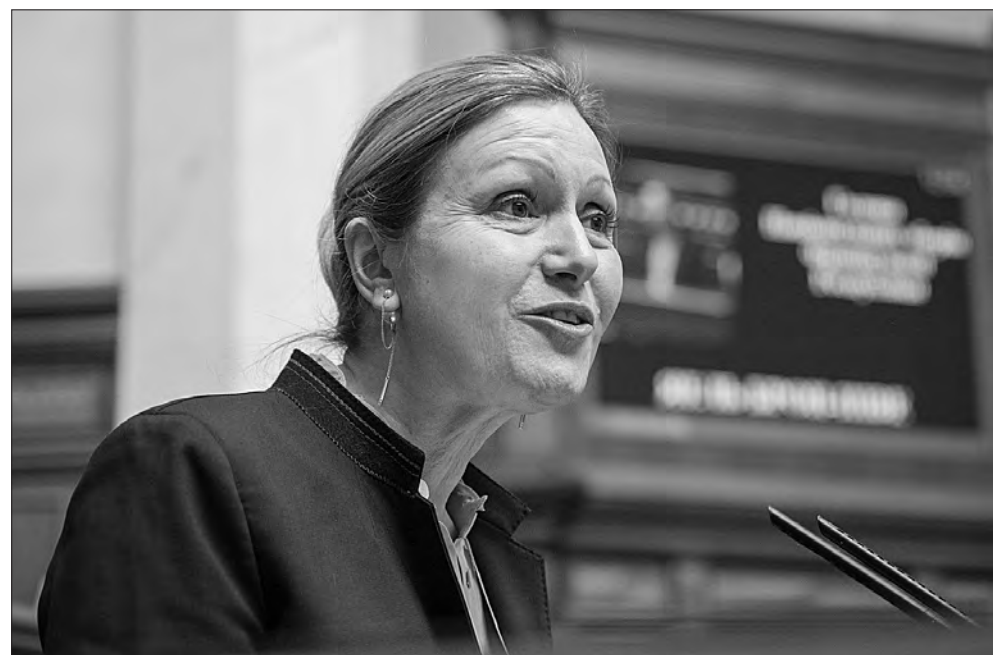
Голова Національних зборів Французької Республіки Яель Брон-Піве.

цію з постачання далекобійних ракет та авіабомб, стала ініціатором танкової коаліції, підтримувала формування коаліції літаків, будувала і буде для України корвети та катери. Крім того, наголосив Голова Верховної Ради, Франція стала першою державою, яка направила спеціалістів для розслідування і документування на деокупованих територіях України воєнних злочинців, які скоєні Росією, консолідувала та розширила невідкладну міжнародну допомогу для підтримки критичної інфраструктури України, заморозила майже 22,8 мільярда євро російських акти-