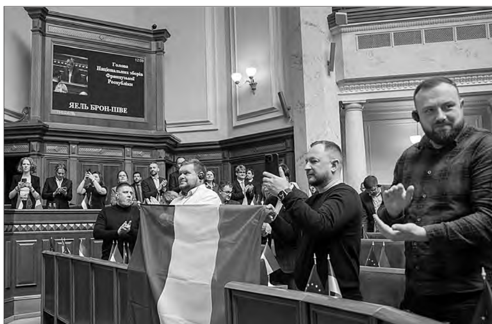
Під час засідання.

«У цьому контексті я з гордістю можу сказати, що Національні збори Франції від самого почат-