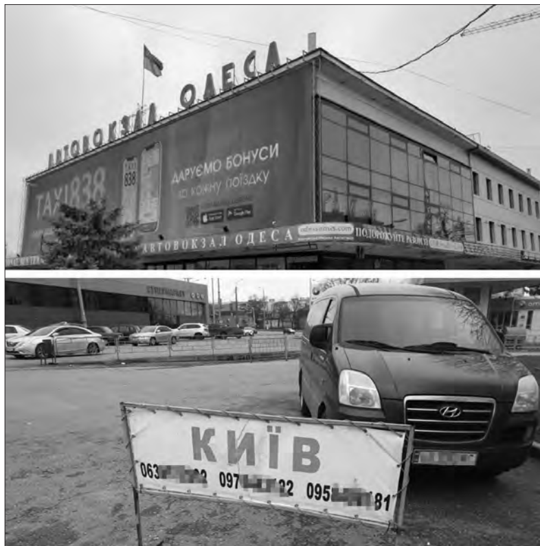
Поки центральний автовокзал в Одесі порожній, поруч працюють нелегали.

Ще один важливий момент: усі офіційні перевізники страхують пасажирів. 1,5—2 відсотки залежно від виду перевезення йде на страхування. У кожному квитку є страховий збір. А нелегали нікого не страхують. Якщо трапляється нещасний випадок на дорозі, то люди за-