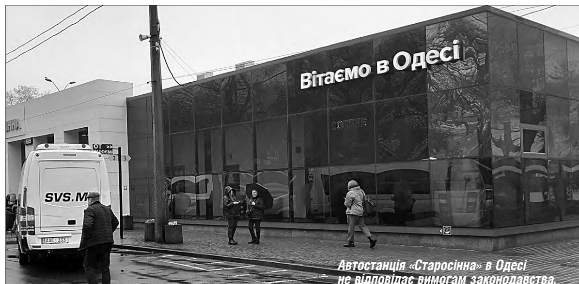
Автостанція «Старосінна» в Одесі не відповідає вимогам законодавства.