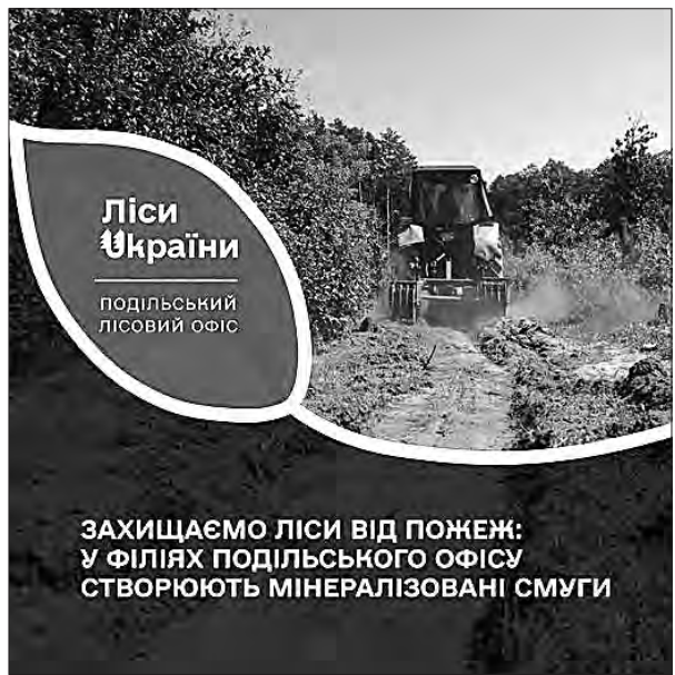
Фото надано лісовим офісом.

Ольга РЖЕПАНСЬКА, прес-служба Подільського лісового офісу.